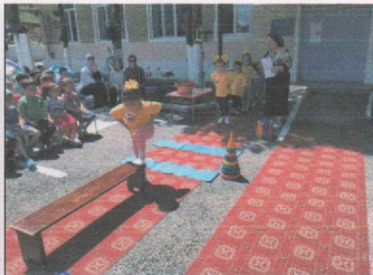
Младшая группа №2