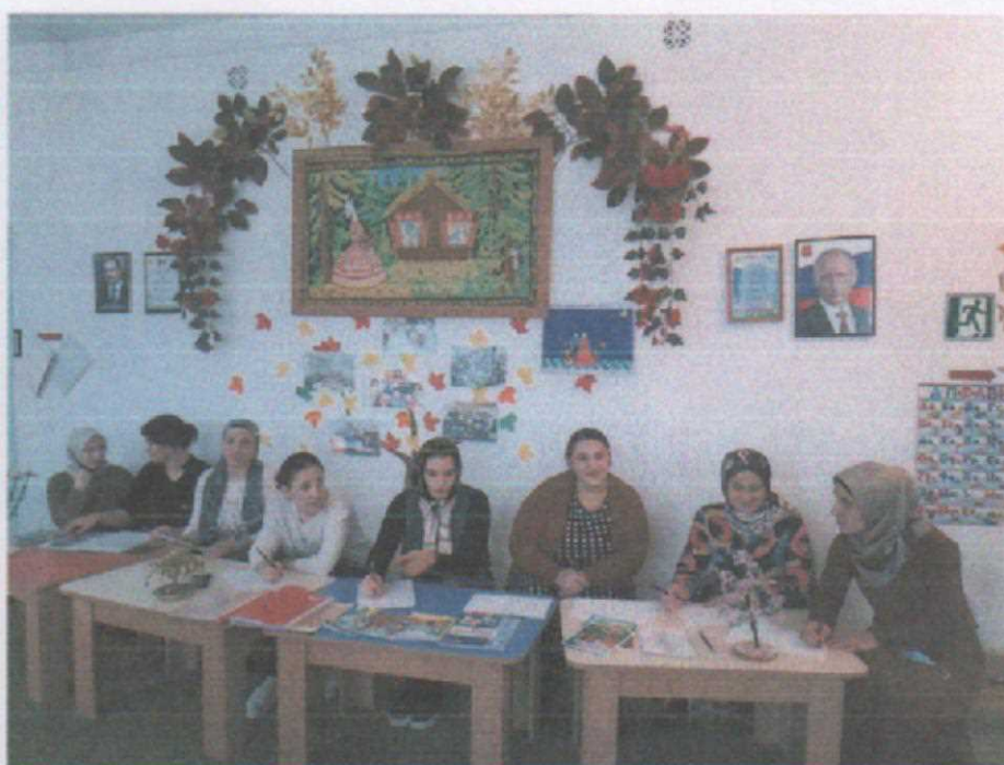
Составление и утверждение плана мероприятий по предупреждению несчастных случаев на водных объектах в весенне-летний период на 2022год. С педагогами ДОУ.