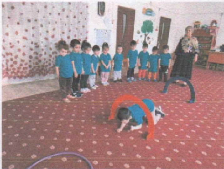
Младшая группа №1