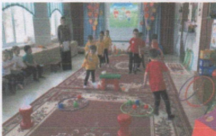
Средняя группа №1